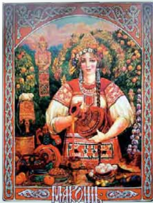
Худ. В. Корольков. «Мокошь»

Действительно, у россиян под воздействием внешних обстоятельств взгляды и действия меняются на противоположные. Происходят внезапные и мгновенные переходы «от любви к ненависти», «из огня да в полымя». Это оказывает разрушительное и дестабилизирующее воздействие на отношения между людьми и делает нас восприимчивыми к манипуляциям. В результате страдает дело. Этот архетип возник во времена объединения славянских племён и русов. Принятие православия, в результате которого наступила ситуация