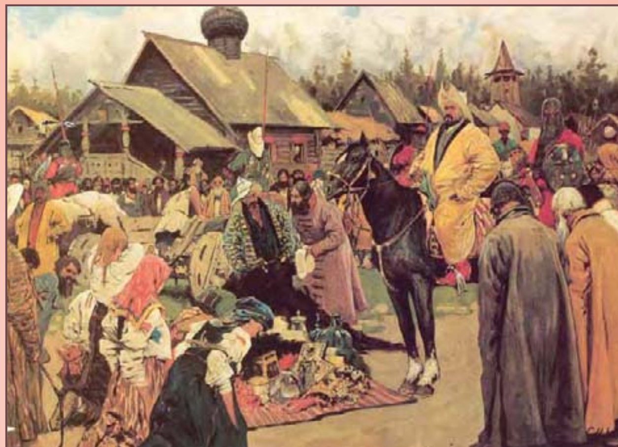
Худ. С. Иванов. «Баскаки»

перепись населения, они начали попытки распространения на Руси своей военной системы. Массовые мобилизации взрослого мужского населения, привели к тому, что была народу «нужда велика». Много русских воинов, участвовавших в походах монголов, погибло. Их часто ставили на самых опасных направлениях. Больше распространение получило устройство армии, когда командирами были монголы, причём до младшего командного звена, а рать состояла из русских воинов. Летописи сообщают о приходе на Русь лиц командного состава — десятников, тысячников и тёмников но ничего не говорят, что вместе с этими лицами командного состава, пришли бы на Русь и монгольские