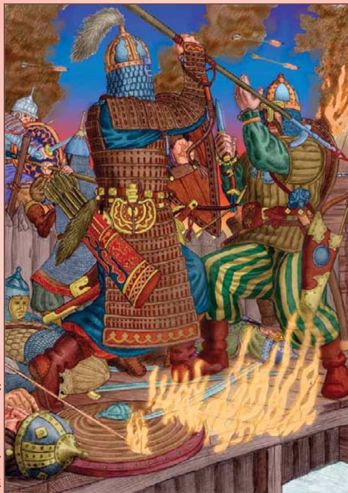
Худ. А. Гусельников. «Бой русичей с баскаками»

В 1300 году дружина Даниила Московского под Переяславлем-Рязанским разбивает сильный ордынский отряд. В 1310 под стенами Брянска отбито нападение другого отряда. В 1315 году под Торжком бьются с ордынцами новгородские дружины. В 1317 году войско князя Михаила побеждает войско Юрия и Кавгадыя, выступавших совместно. Эти бои не могли ослабить орду,